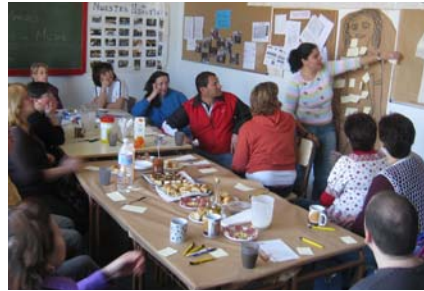
Grupo de encuentro familias martes mañana.

Queremos que estos grupos sean un espacio de encuentro, de compartir las inquietudes que supone la educación de los hijos, pero también un espacio de desarrollo y crecimiento personal. Durante este curso hemos recibido la aportación de distintas personas que han venido a darnos charlas sobre educación para salud, ocio y tiempo libre, orientación para el estudio de los hijos, prevención de la drogadicción, etc. También nos hemos divertido y enriquecido con talleres de cocina, manualidades, maquillaje, etc. Y