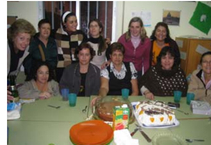
Grupo de encuentro familias lunes tarde

pecialmente a los padres a que se animen a participar y proponer actividades que puedan resultar interesantes.