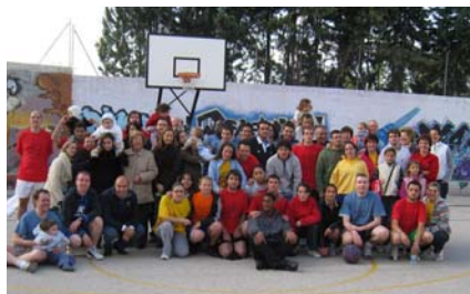
Partido Homenaje XVIII torneo

Y cada año intentamos superarnos. Parece que todo se paraliza esa semana, todos pendientes de las actividades y de que nos haga buen tiempo. Sabemos que tenemos muchas cosas que mejorar y nunca esperaremos que salga todo perfecto. Nuestros jugadores y jugadoras desean que lleguen esos días, para que les vengáis a ver jugar: amigos, familia, profesores, etc. Los entrenadores sacan su bagaje técnico para darlo todo. Después todos ponemos nuestro granito de arena y buscamos colaborar en todas las actividades; no hay apenas descanso en los siete