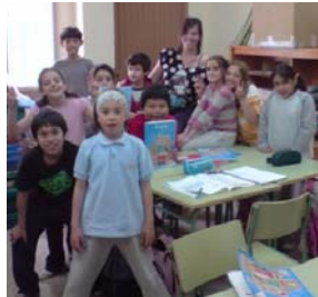
Pinar del Rey martes y jueves