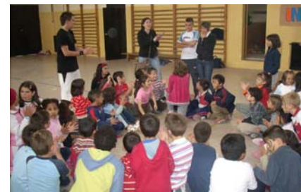
Gymkhana infantil del torneo 2008.

Estos días, gracias a vosotros seremos muchos más, no solo por los que os habéis enfrentado a nosotros en las competiciones municipales o de la federación madrileña durante este año, también los que venís desde