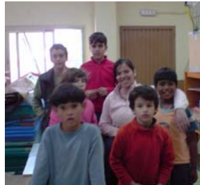
Pinar del Rey lunes y miércoles