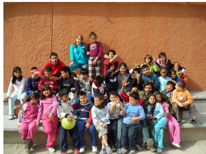
Grupo de apoyo al estudio del San Miguel. 17