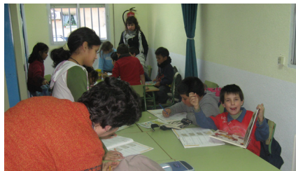
18 Nos divertimos y estudiamos.

- ¡¡Qué va!! no estudiamos todo el rato, dedicamos la última parte de la clase a hacer otras cosas, o bien jugamos a algún deporte o hacemos alguna dinámica, también talleres, conectarnos a Internet para hacer los trabajos y buscar información. Todos los comienzos de curso nos preguntan que queremos ha-