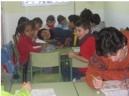
Los peques con los deberes y .....

mos, hacemos talleres, los más pequeños meriendan todas las tardes, hablan con los profesores, nos dan animo, les importamos, nosotros confiamos en los monitores, les contamos nuestras cosas. Y ellos nos insisten en hacernos pensar y actuar con libertad y responsabilidad, a veces se pasan con las charlas, pero también reconozco que también noso-