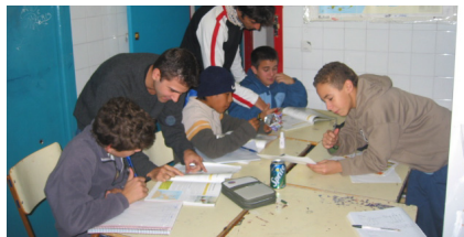
Ayudando a hacer los deberes.

cer, e intentan que podamos hacerlo. Y al final de curso hacemos actividades todos los chicos y chicas de la asociación.