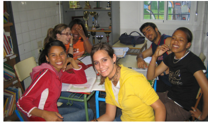
Con las profes de Mates.

Mira, estudiamos, hacemos los deberes, aprendemos como estudiar mejor, como concentrarnos, como mejorar las notas, hablamos, nos escuchan, formamos parte de la asociación, nos reímos, a veces también nos enfadamos, juga-