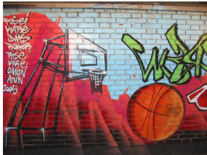
Mural en el IES Rosa Chacel. 5

No llevo muchos años en la Asociación, es más, no llevo mucho años en el país, y no se si seguiré aquí dentro de un par de años. Lo que sí se es que en todo este tiempo no me había sentido tan a gusto y tan integrado como ahora. Por ello este torneo es sinónimo de alegría, porque niñ@s, entrenadores y hasta padres se lo pasan “pipa”, y porque entre tanto juego y tantas sonrisas no hay lugar para las peleas y eso. Eso es La Torre.