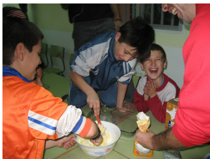
Taller de tartas.

de no volver, las ganas que sean más días de campamento, el cansancio, la vuelta a casa, los platos de metal, la cantimplora, la gorra para el sol, las canciones de los monitores.