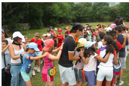
En Los Molinos.

La primera noche para algunos fuera de casa, el primer vuelo en avión, las ganas