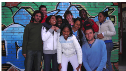
Grupo de apoyo al estudio 3º y 4º de la ESO

- Bueno, que empieza el partido de baloncesto. ¡¡ Animo la Torre!!