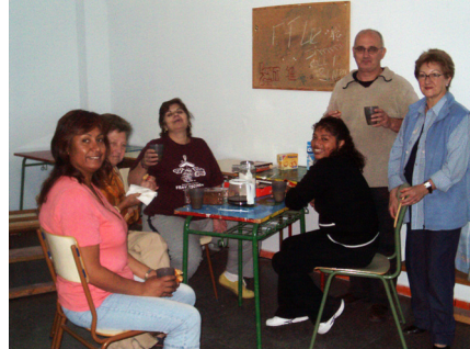
Grupo de discusión.