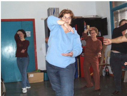
Practicando Tai chi.

Como el resto de la Asociación, el grupo de Familias está formado voluntarias y voluntarios que pretendemos acercarnos a la realidad de las familias que forman parte de la Asociación, fomentando valores que promuevan una sociedad mas justa y democrática, y una participación activa en el barrio de la UVA.