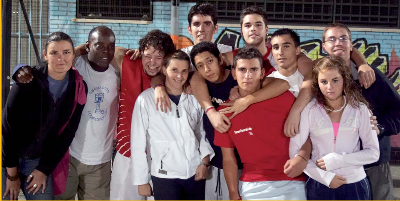
El baloncesto como motor educativo, modelo de vida sana y medio de integración

Para más información: www.latorredehortaleza.org